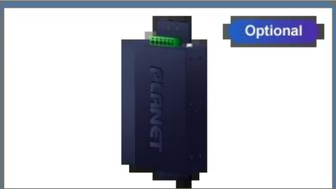
Side Wall Mounting (Space saving)