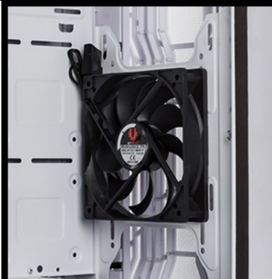
240mm or 280mm or 360mm ( radiator )