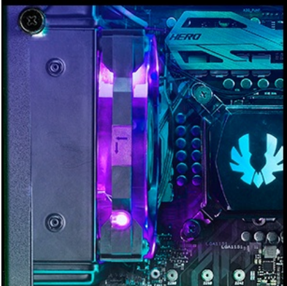
120mm ( radiator )