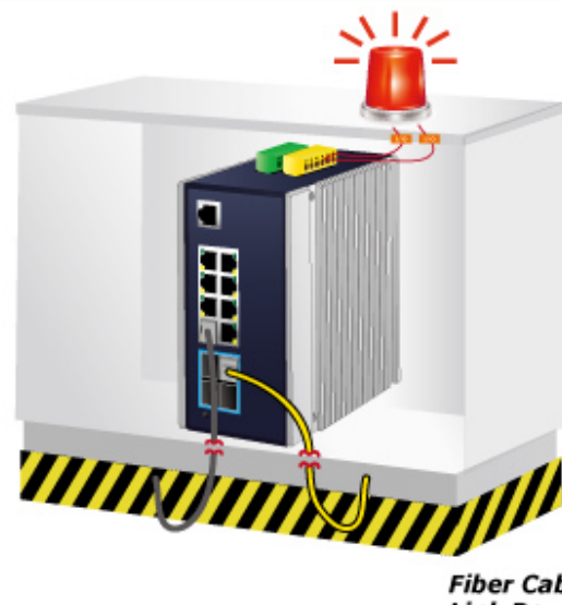
Fiber Cable Link Down