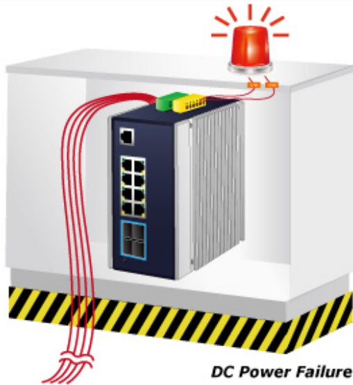
DC Power Failure